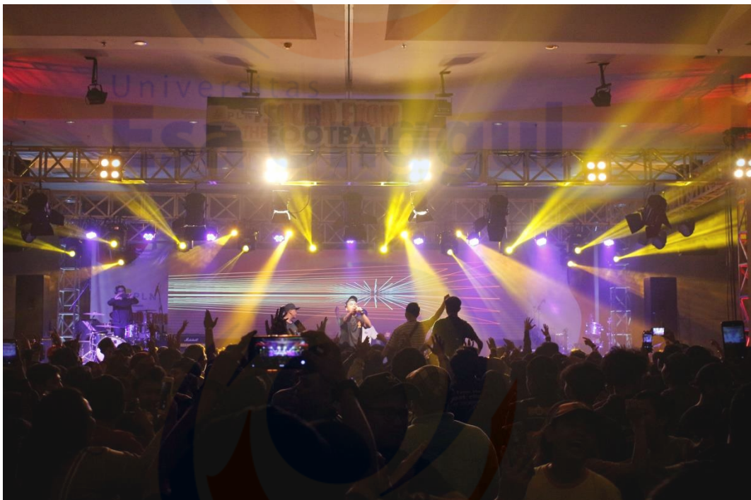
Penulis saat sedang melakukan liputan Sound From The Football di kawasan Kuningan City