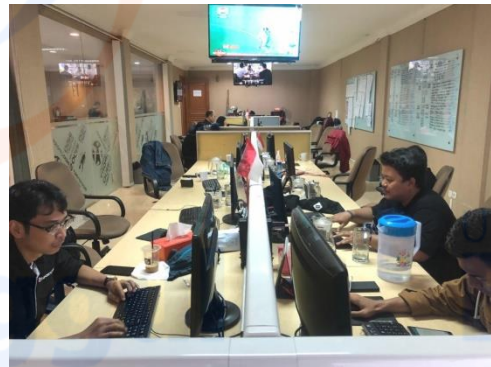
Ruangan tim redaksi INDOSPORT