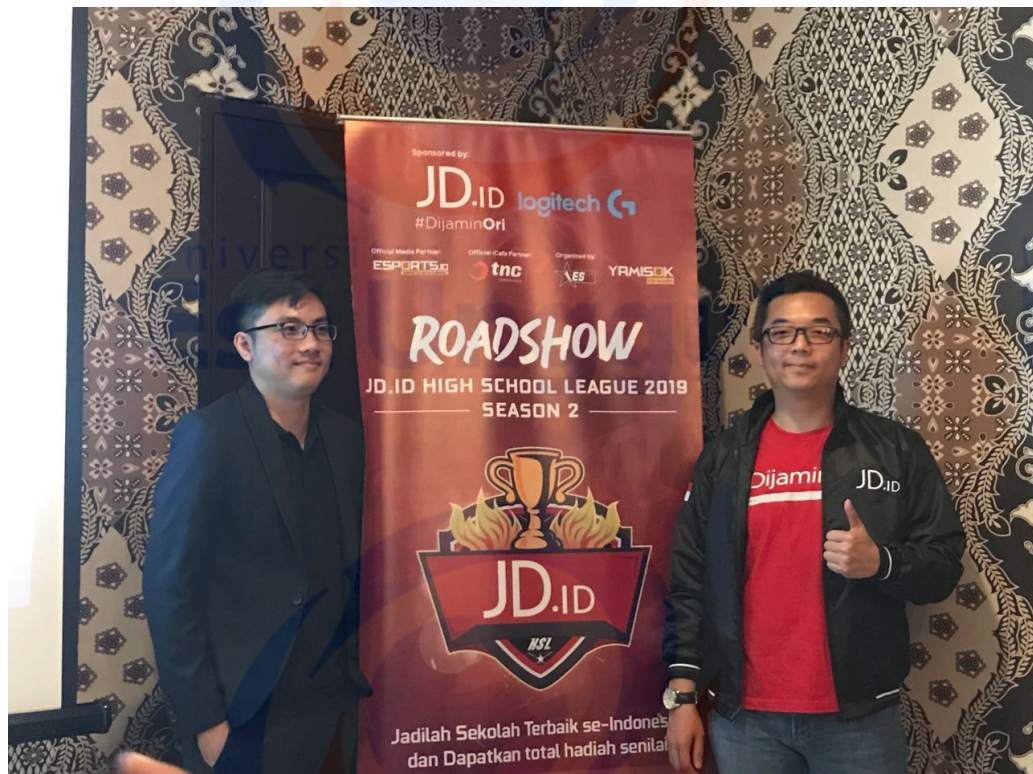
Penulis saat di lokasi konferensi pers JD.ID High School League