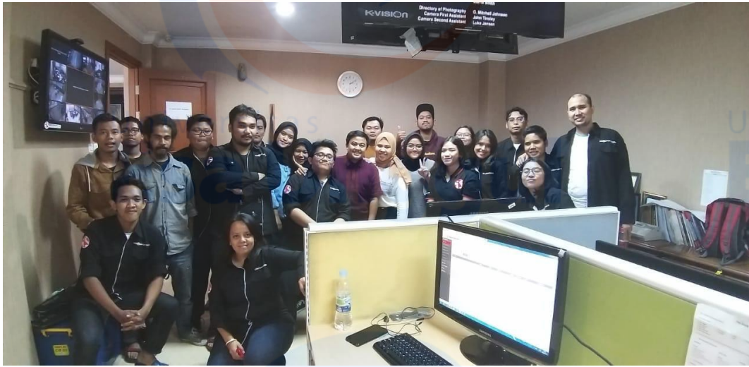
Foto penulis bersama tim redaksi INDOSPORT saat perpisahan