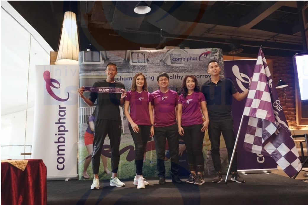
Penulis saat di lokasi konferensi pers Combi Run 2019 di Mall Kasablanca