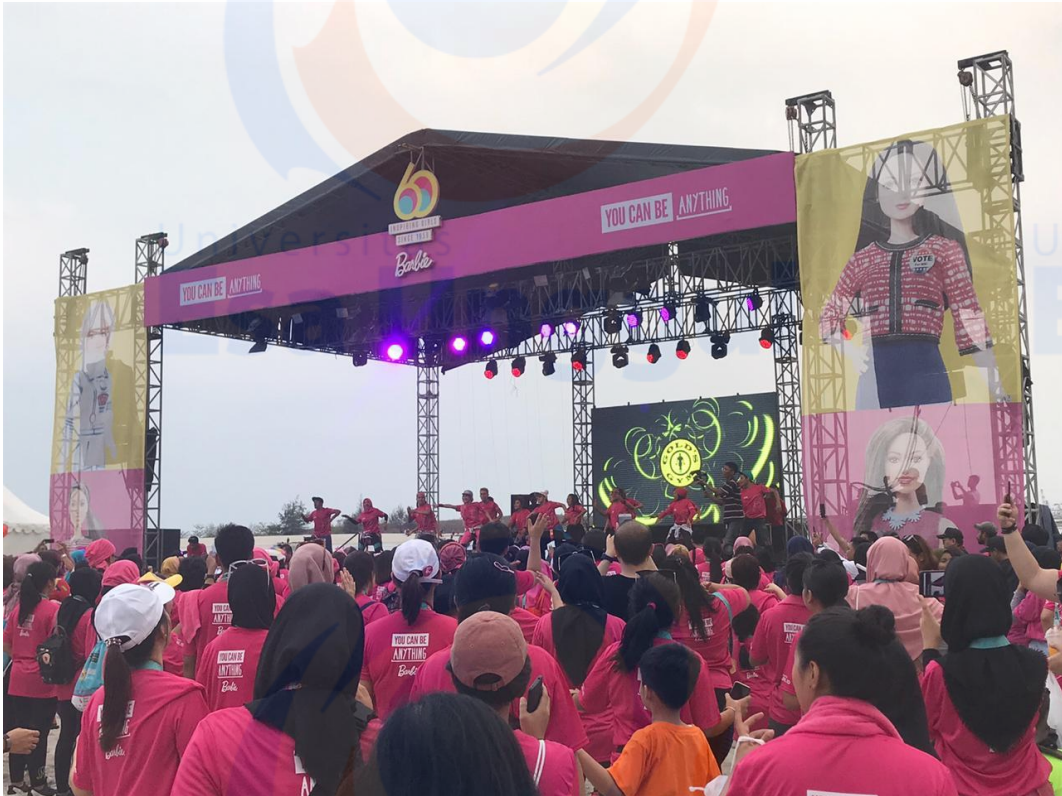
Penulis saat sedang melakukan liputan Barbie Run 2019