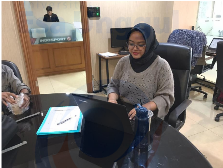
Foto penulis saat menjadi reporter newsroom