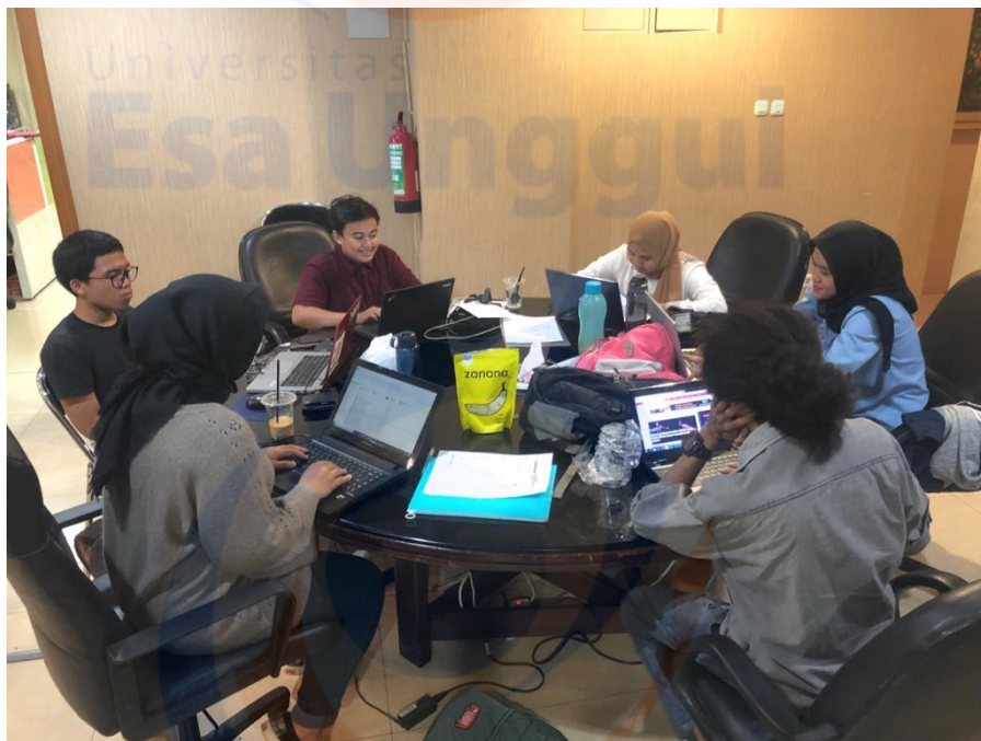
Foto penulis bersama dengan mahasiswa magang lainnya saat bekerja sebagai reporter newsroom .